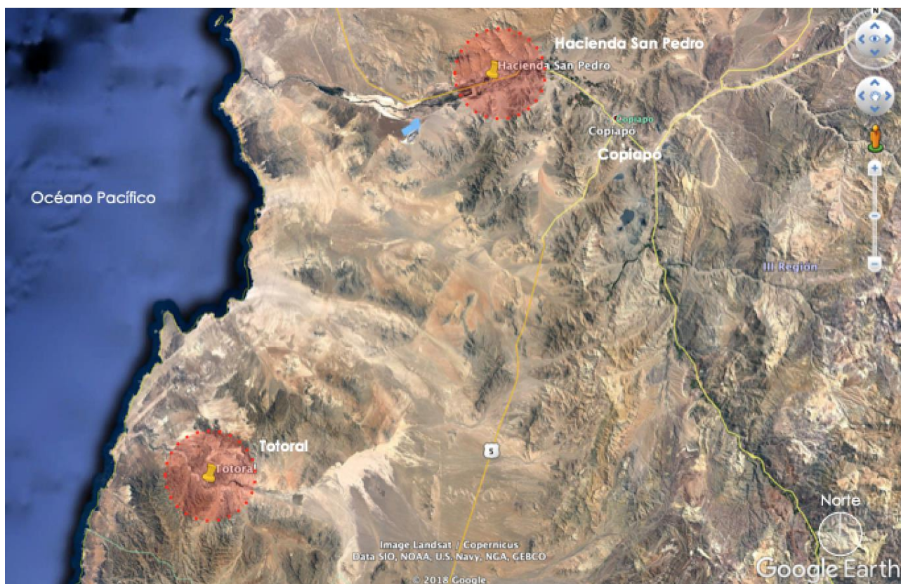
Ubicación de cada localidad a desarrollar estudio.

A su vez, diversos países del mundo han recurrido a revivir antiguos elementos de su historia como recurso patrimonial para el desarrollo del turismo. Uno de estos elementos es el Patrimonio Rural, el cual integra una serie de actividades económicas y culturales que tienen un potencial único por cada localidad a estudiar, sus productos agrícolas, los sub productos potenciales a desarrollar, la arquitectura que integra cada localidad en base a un servicio en específico, etc.