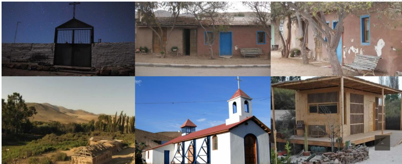
Fotografías de la tipología arquitectónica en Totoral